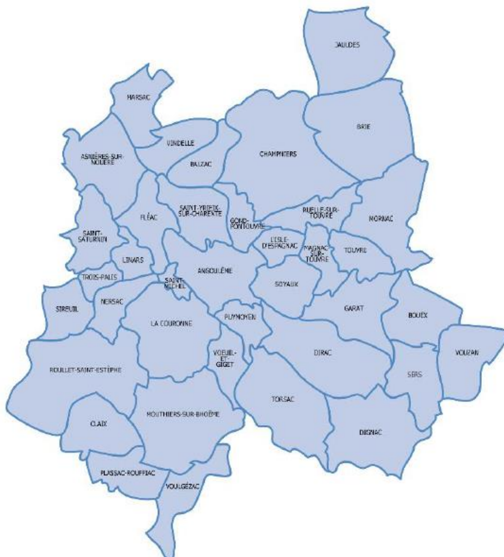
Figure 1 : Territoire du GrandAngoulême

Parmi ses compétences se trouve celle des déchets ménagers. Le service Déchets Ménagers de GrandAngoulême, dans le cadre des services de proximité rendus à la population, intervient dans la collecte et le tri de l'ensemble des déchets produits par les ménages de son territoire. Le traitement des déchets est quant à lui géré par le syndicat CALITOM.